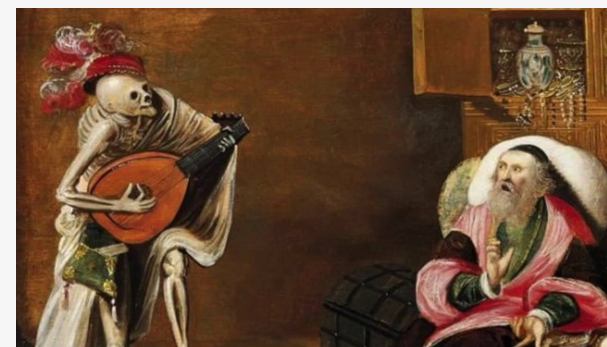
FOLLIA DEL MONDO