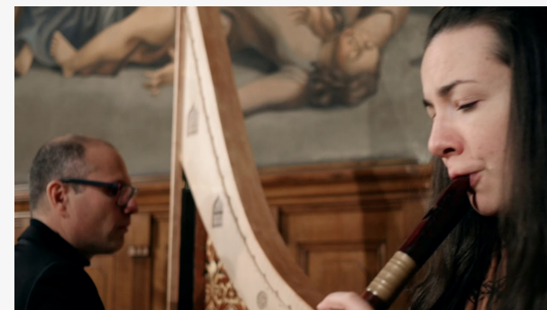
CHE DEBBIO FARE