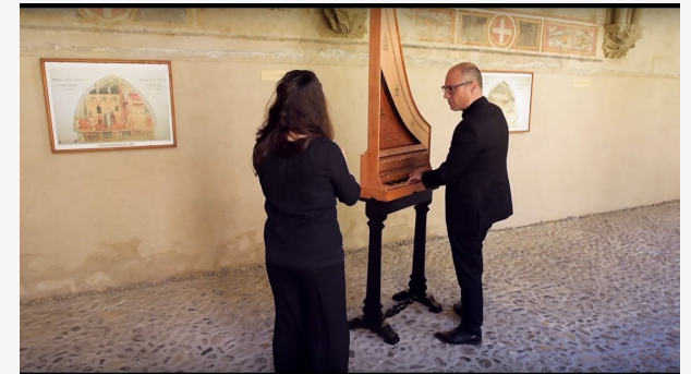
ELAS MON CUER