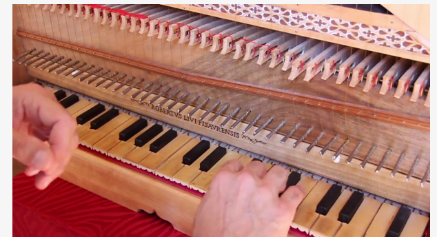
NON NA AL SUO AMANTE