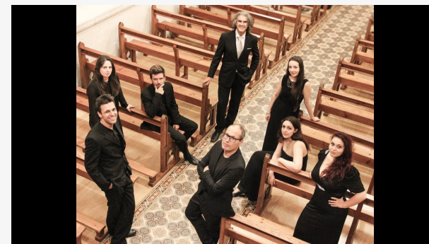
FUGI FUGI FUGI